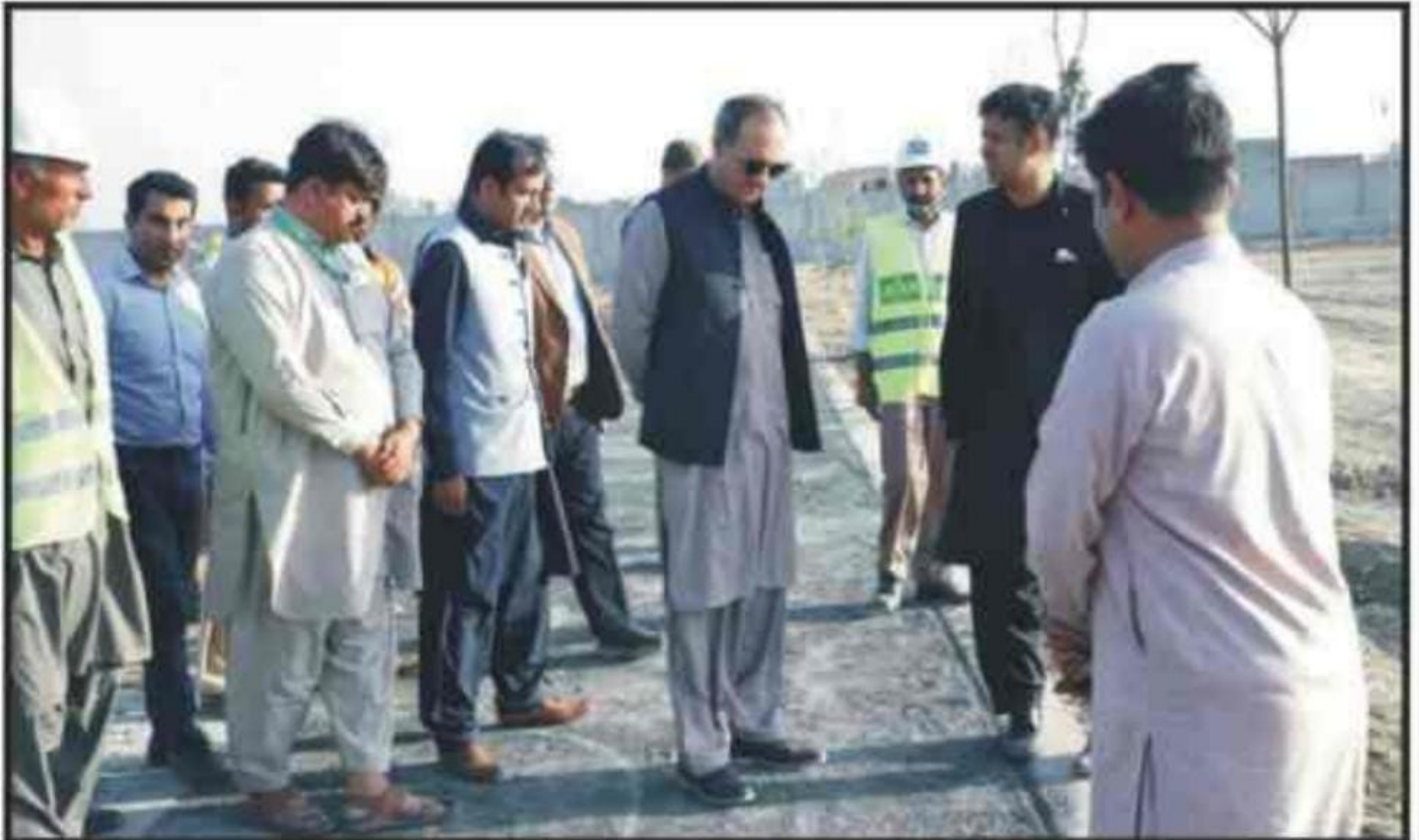
اوکاڑہ: سیکرٹری لوکل گورنمنٹ تشکیل احمد میاں حبیب جالب پارک میں ترقیاتی کام کا جائزہ لیتے ہوئے

رینالہ خورد (تحصیل رپورٹر) سیکرٹری لوکل گورنمنٹ تشکیل احمد میاں کا دورہ اوکاڑہ۔ تشکیل احمد میاں کی زیر صدارت ڈسٹرکٹ کمپلیکس میں اجلاس کا انعقاد اور بعد ازاں مختلف ترقیاتی سکیموں کا دورہ۔ ڈپٹی کمشنر ڈاکٹر محمد ذیشان حنیف نے سیکرٹری لوکل گورنمنٹ کوورلڈ بینک (صفحہ 3 بقیہ نمبر 82)