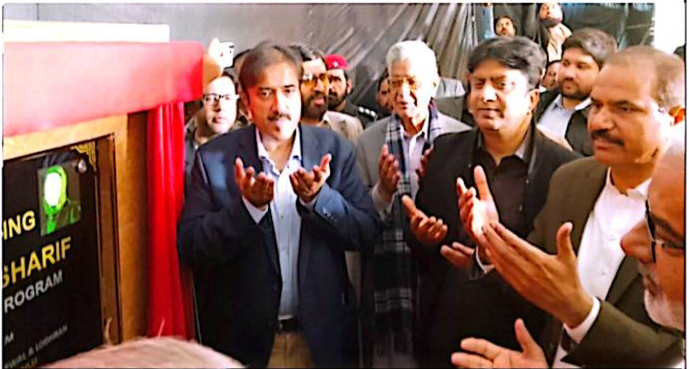
BUREWALA: Provincial Minister Zeeshan Rafiq offers prayers after unveiling the plaque at the inauguration of the PDP ceremony.