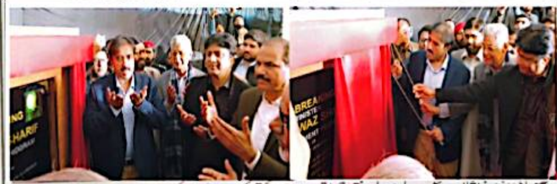
صوبائی وزیر فریشن رفیق پروگرام کی افتتاحی تقریب میں حتیٰ کی نقاب کشائی کے بعد دعا مانگ رہے ہیں۔