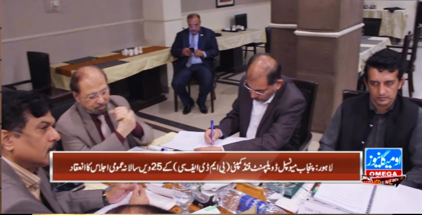
لاہور: پنجاب میونسپل ڈویلپمنٹ فنڈ کمپنی (بی ایم ڈی ایف سی) کے 25 ویں سالانہ عمومی اجلاس کا انعقاد