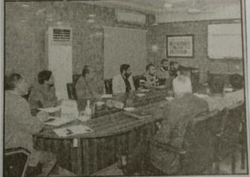
لاہور: پیپرس ورکنگ سسٹم ڈیولپمنٹ ٹریننگ کے حوالے سے اجلاس کا انعقاد ہو رہا ہے

روزنامہ طاقت 29 DEC 2022 Page No: 2 Column 2